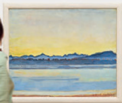
Ferdinand Hodler. Genfersee mit Mont-Blanc am frühen Morgen, März 1918. (Versteigert durch Koller Auktionen für CHF 7,4 Mio.)

Beim Kauf oder Verkauf von Kunst beraten wir Sie gerne!